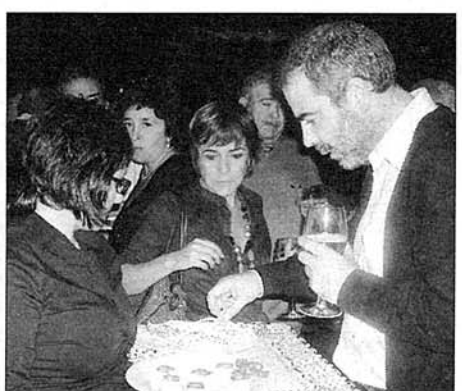
El cóctel se ofreció en la terraza del Hotel.