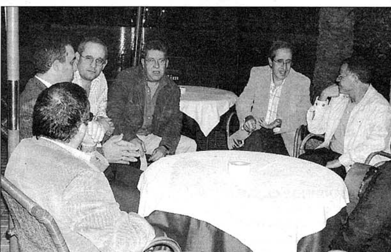
Tomando el aperitivo en la Plaza de la Catedral, disfrutando de la noche almeriense.