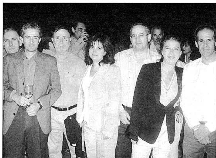
Congresistas de Almería, Granada y otras provincias en la Terraza del Catedral.

Igualmente se llevó a cabo una visita guiada a la ciudad durante el día y acudieron a la Alcazaba que visitaron, acompañados de un guía turístico. No faltó un amplio recorrido por el Parque Natural de Cabo de gata - Níjar, donde pudieron comprobar su belleza paisajística y ver de cerca las colonias de flamencos y otras aves que habitan habitualmente en las charcas de las Salinas.